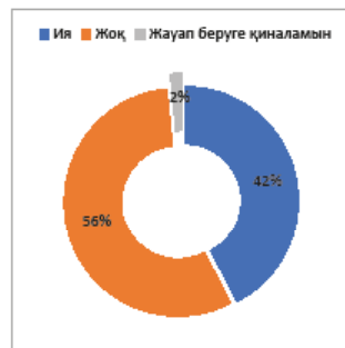
Сурет 3. «Мәдени көптірлік көрініс тапқан анимациялық туындыларды білесіз бе?» деген сұраққа жауап беру көрсеткіші. (% респонденттер, N=238)

Сауалнамаға қатысушылардың 66% өзге елдің мәдениетін анимациялық фильмдерде өзі ойлағандай көрініс тапқанын кездестіргенін айтса (сурет 2.), 42% мәдени көптірлік көрініс тапқан анимациялық туындыларды білетіні туралы жауап берген (сурет 3.).