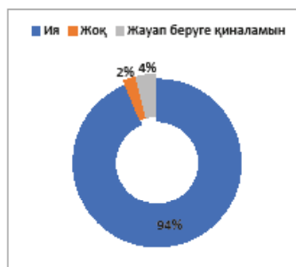
Сурет 1. Анимациялық фильмдер өзге мәдениет ерекшеліктерін көрерменге жеткізе алады ма? деген сұраққа жауап беру көрсеткіші. (% респонденттер, N=238)

8,8% жауап беруге қиналатынын айтқан. Респонденттердің 93,7% мультфильм бұл өзге ұлттар мәдениетін танудың қайнар көзі екенін атап өткен (сурет.1).