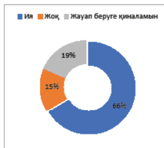
Сурет 2. Өзге ел мәдениеті сіз ойлағандай көрініс тапқан кезі болды ма? деген сұраққа жауап беру көрсеткіші. (% респонденттер, N=238)

Сауалнамаға қатысушылардың 66% өзге елдің мәдениетін анимациялық фильмдерде өзі ойлағандай көрініс тапқанын кездестіргенін айтса (сурет 2.), 42% мәдени көптірлік көрініс тапқан анимациялық туындыларды білетіні туралы жауап берген (сурет 3.).