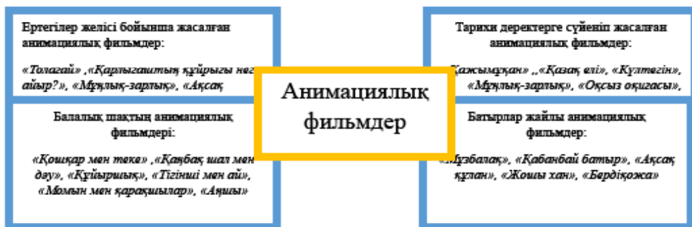
Сурет 5. Мәдениет пен ұлттық бірегейлікті айшықтайтын мультфильмдер

желісі қазақтың болмыс-тіршілігімен тығыз байланысты. Батырлар-қазақ ұғымында орасан күш иесі ғана емес, қажет болса өмірін сарп етуге дайын ел қорғаушысы. Аңызда Толағай бейнесі арқылы ұлттың мінезін, қайсарлығы мен мейірімділігін аңғаруға болады. «Ордабасы» мультфильмі желісі тарихқа негізделген. Онда Ордабасы тауында жоңғарларға қарсы жорыққа қазақтың үш жүзі бас қосып, тойтарыс беру арқылы бірлік пен отансүйгіштіктің озық үлгісін көрсетеді.