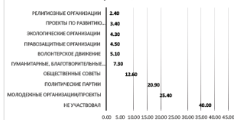
Участие молодежи Казахстана в различных организациях

Сумма не равна 100%, т.к. респонденты могли выбрать несколько вариантов ответа