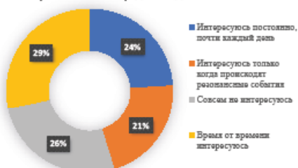
Рисунок 1: Интерес к политике среди молодежи Казахстана