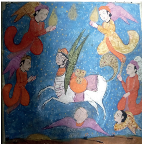
(№2 миниатюра: Пайғамбардың көкке көтерілу көрінісі, 4b том) [16, 9-6].

Сағди Ширазидің «Ләйлә мен Мәжнүн» поэтикалық мұрасындағы пайғамбарлық көтерілу мотиві адам жанын тазарту, нәпсіні тәрбиелеу және махаббат арқылы кемелдікке жету идеясымен сабақтастырылады.