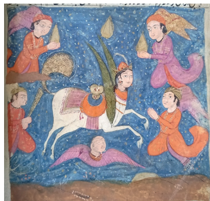
(1-миниатюра: Пайғамбардың көкке көтерілу көрінісі, 3b том) [15, 8-б.].

Атап айтқанда, «Махзан әл-Асрар» («Құпиялар қазынасы») поэмасының кейбір иллюстрациялық қолжазба нұсқаларында берілген Миғраж көріністері мәтіндік мазмұнды иконографиялық деңгейде тереңдететін визуалды-герменевтикалық модель ұсынады.